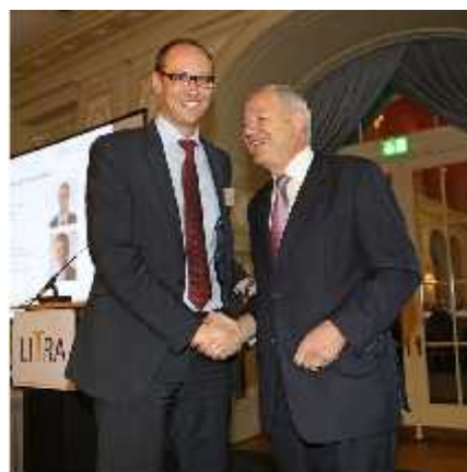
Neuer und alter Präsident LITRA