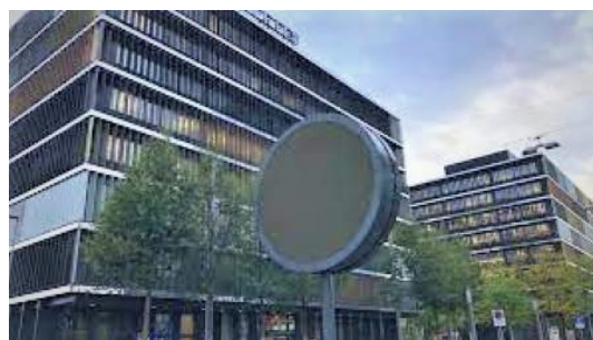
Die legendäre SBB-Uhr - ausgeschaltet

Um die Stromspeicherreserven zu schonen, hat die SBB weitere Massnahmen in ihren Bürogebäuden festgelegt: Unter anderem wird die Beleuchtung reduziert, die Klimatisierung bzw. Beheizung optimiert und das Warmwasser zum Händewaschen abgestellt. Weiter werden keine SBB Logos auf den Bürogebäuden mehr beleuchtet und die grosse Uhr am SBB Hauptsitz im Wankdorf wurde bereits ausgeschaltet. Die SBB wird dieses Jahr keine Weihnachtsbeleuchtungen in den eigenen Gebäuden und den Bahnhöfen installieren. Dort wo möglich, werden alternative festliche Dekorationen angebracht.