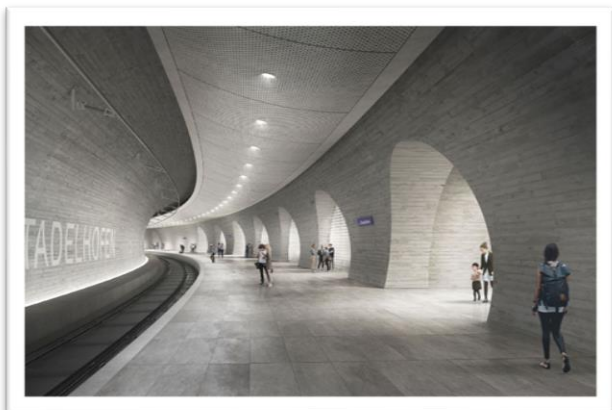
Visualisation du projet de quai pour la voie 4 à la gare de Zurich Stadelhofen.