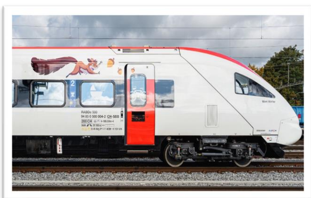
L'ICN RABDe 500 004 «Mani Matter» des CFF a été la première rame automotrice à bénéficier de la révision.

Les CFF façonnent la mobilité de demain et vont investir ces prochaines années près d'un milliard de francs tous les ans dans des trains neufs et modernisés, socle d'un chemin de fer moderne. En 2019, les CFF ont commencé à rénover entièrement les IC 2000, qui sont ainsi prêts à circuler les 20 prochaines années sur le réseau grandes lignes en Suisse. Avec 62 trains, les duplex TGL constituent la plus grande flotte du trafic grandes lignes des CFF. Ils ont remplacé différents véhicules plus anciens. Le duplex TGL fait aujourd'hui partie des trains les plus fiables des CFF et constitue le vaisseau amiral du