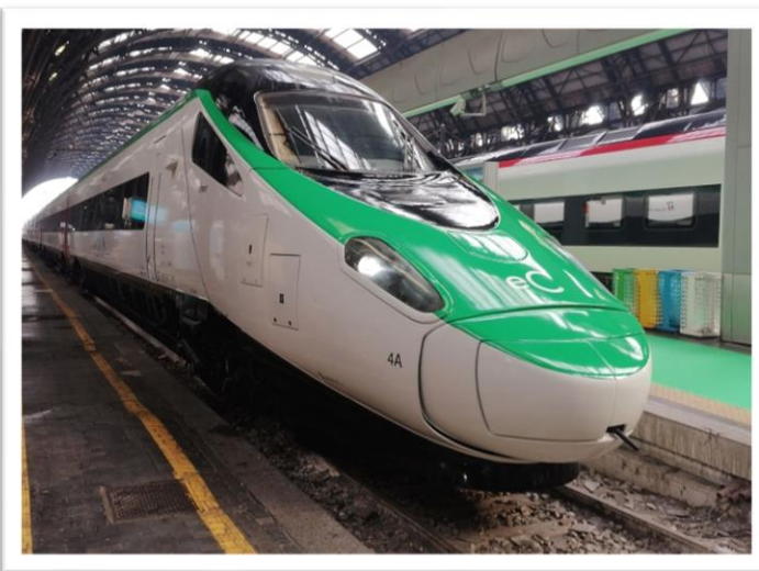
Premier train à avoir bénéficié de la modernisation, le Trenitalia ETR 610 004 a été présenté au public le 8 novembre 2024 à Milano Centrale.

La signature de l'accord a également été l'occasion de présenter la nouvelle marque euroCity et les trains de Trenitalia modernisés, équipés de sièges recouverts d'un tissu entièrement fabriqué à partir de plastiques recyclés, proposant de nouveaux services et arborant une ligne mise au goût du jour. Parmi les couleurs utilisées rappelant les drapeaux des deux pays, le vert est la couleur distinctive de la marque: il est utilisé pour le logo, mais aussi pour de nombreux autres éléments à l'intérieur des voitures. Le vert rappelle également le thème de la durabilité, puisque le train est le moyen de transport le plus durable pour se rendre en Suisse.